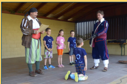
MŠ - pasování předškoláků