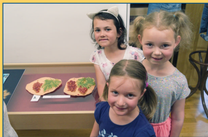
MŠ - vernisáž "Obrázky z mojí obce"