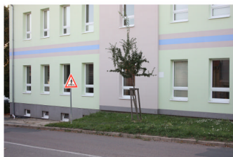
ŠKOLA - PŮVODNÍ VCHOD