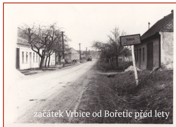
začátek Vrbského Újezdu od Bořetic před lety