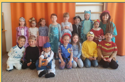
MŠ - Den dětí v Motýlích