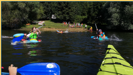
Skauti na vodě