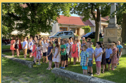
ZŠ - slavnostní ukončení školního roku