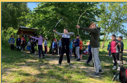
ZŠ - Den dětí v přírodě