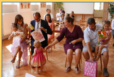
Někteří občané už letos při vítání občánků "cupitali"