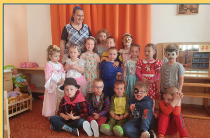
MŠ - Den dětí v Kofátkách