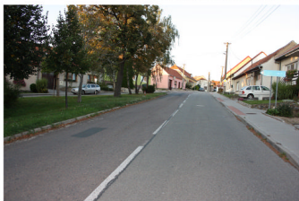
"DĚDINŮ KOLEM PARKU"