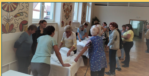
Kurz žehlení a strojení vrbeckého kroje