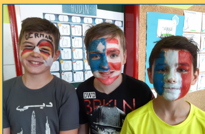
ZŠ - malování na obličej