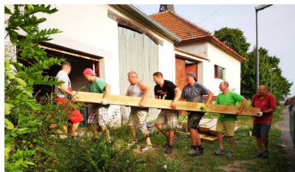
Uskladnění dubového dřeva na opravu křížů na faře