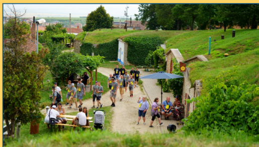
"Sklepy pod hvězdami"