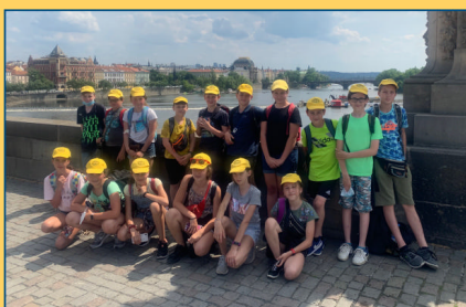
ZŠ - páťáci v Praze