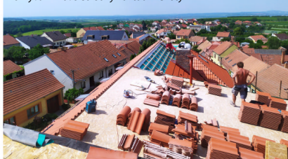
Výstavba sociálního bydlení