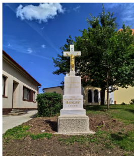
Mainclův kříž u fary

Donedávna byl zarostlý a někteří z nás si ani nevšimli, či nevzpomněli, že tam taková nádhera stojí. Na opravu se nám podařilo získat příspěvek z Jihomoravského kraje, za což jsme rádi a velmi děkujeme.