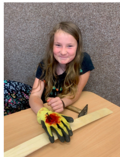
Hřebík v Doubravčině ruce

V úterý 22. 6. si připravili žáci páté třídy pro ostatní děti naší školy zážitkový den a názvem „DEN PRVNÍ POMOCI“. Všem předcházela několikátýdenní příprava, během níž jsme vybrali příhodné situace, tyto scény převedli do reálného života, dramaticky je secvičili a pro věrohodnost použili umělou krev či tetování s reznými ranami. Děti tak mohly na vlastní oči spatřit popáleninu, člověka v bezvědomí, krvácející poranění hlavy a nosu, vymknutý kotník nebo zapíchnutý hřebík v dlaní. Na některých stanovištích si děti přímo vyzkoušely