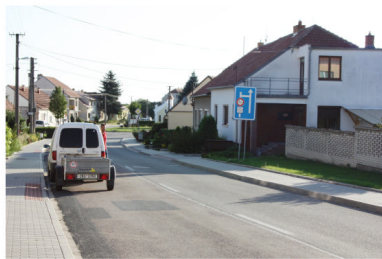
HLAVNÍ CESTA - u domu č. 1