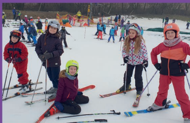
ZŠ - Lyžařský kurz v Němčičkách