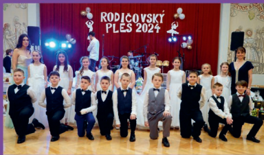
ZŠ - Rodičovský ples