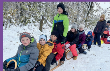
ZŠ - Bobování v Hájku