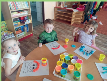
Pracujeme v MŠ