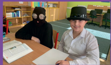
ZŠ - Vyučování v maskách