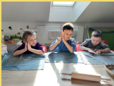
V keramické dílně