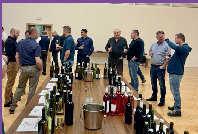
Žehnáni mladých vín