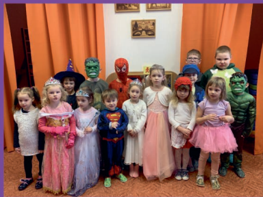
MŠ - Maškarní karneval v Kotátkách