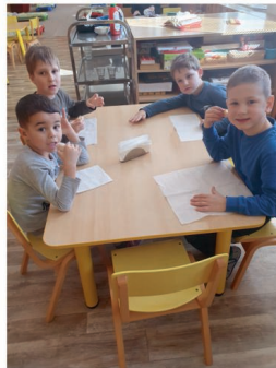
Chutnáme vlastnoručně vyrobené koblížky