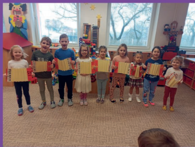
MŠ - Hudebníci