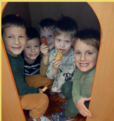
Hrajeme si v MŠ