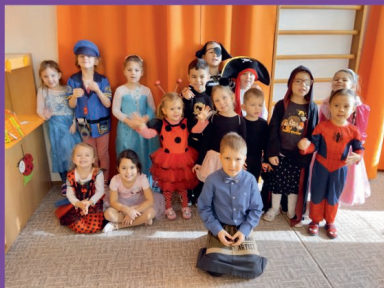
MŠ - Maškarní karneval v Motylčích