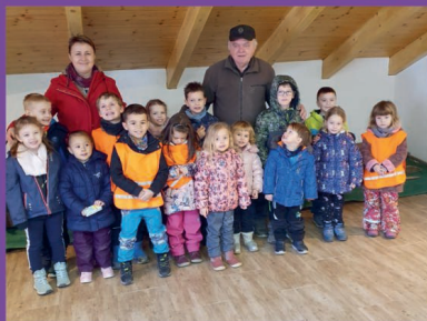
MŠ - Návštěva muzea