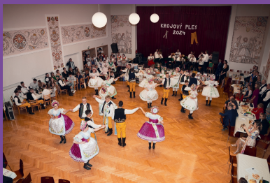
Krojový ples - Česká beseda